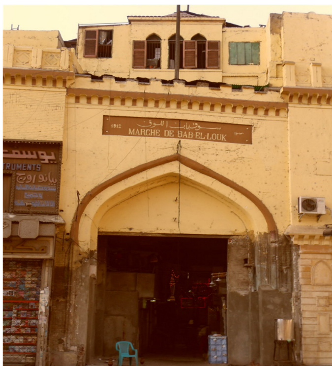
La porta di ingresso al mercato